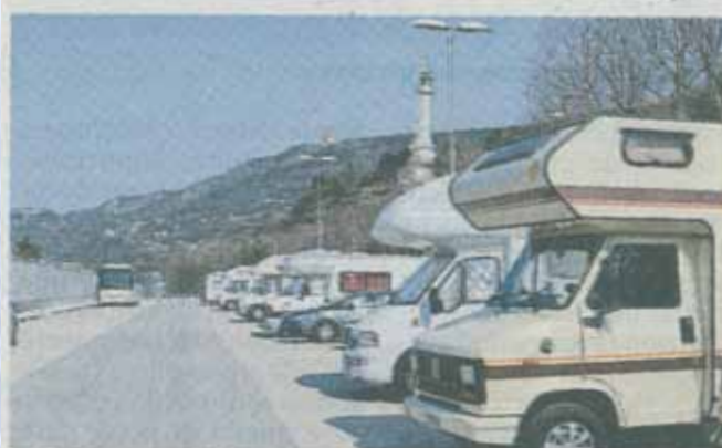
Una delle aree parcheggio al centro delle polemiche.

vedo ci sono lavori in corso che stanno togliendo posti e poi gli stalli a pagamento per i camper sempre vuoti ma inutilizzabili. In viale Miramare i posti auto sono stati tolti da tempo e gli autobus del pomeriggio diretti in città sono sempre carichi di persone. Ci chiediamo come i nostri 2 mila utenti potranno raggiungere o andare via dai due stabili-