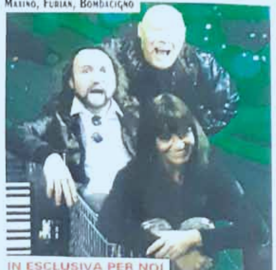
IN ESCLUSIVA PER NOI