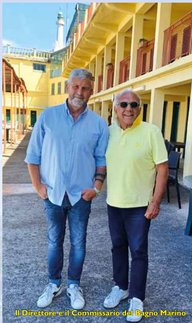
Il Direttore e il Commissario del Bagno Marino

Certamente mi fa molto piacere sapere che i nostri soci sono soddisfatti dei servizi offerti, ne è la prova la grande richiesta di abbonamenti, parte dei quali non abbiamo potuto soddisfare, perché a seguito delle misure anti Covid-19 abbiamo dovuto rispettare le distanze di legge a scapito delle presenze.