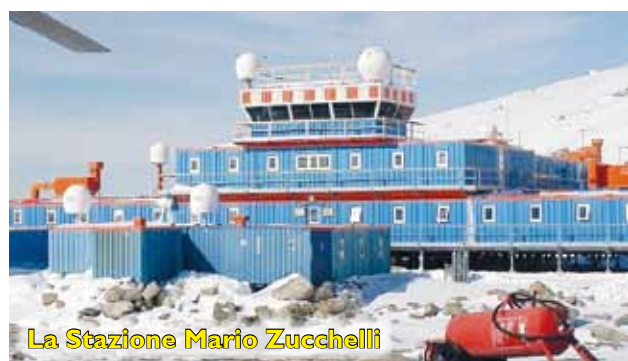
La Stazione Mario Zucchelli

La ricerca polare oggi riceve a livello globale una sempre maggiore attenzione vista l'importanza di queste aree nelle dinamiche climatiche globali. In particolare, la ricerca in aree polari è prioritaria per l'Italia, membro del Trattato Antartico e osservatore del Consiglio Artico. Per questo motivo la N/R Laura Bassi ha tra i suoi obiettivi non solo di consentire la ricerca oceanografica e geofisica dei ricercatori dell'Ente e della comunità scientifica nazionale ed europea ma anche di fornire supporto scientifico e logistico alle missioni polari italiane trasportando, per esempio, beni e risorse umane da e verso la Stazione Mario Zucchelli, la base di ricerca italiana in Antartide.