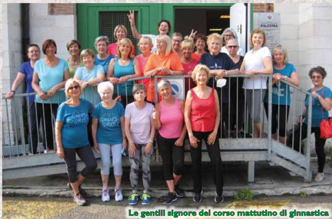
Le gentili signore del corso mattutino di ginnastica

8ª Prova Dom. 23 ottobre 2022 BAGNOLI d.ROSANDRA XLII SU E ZO PEI CLANZ KM. 9,3 Org. C.A. FINCANTIERI WARTSILA