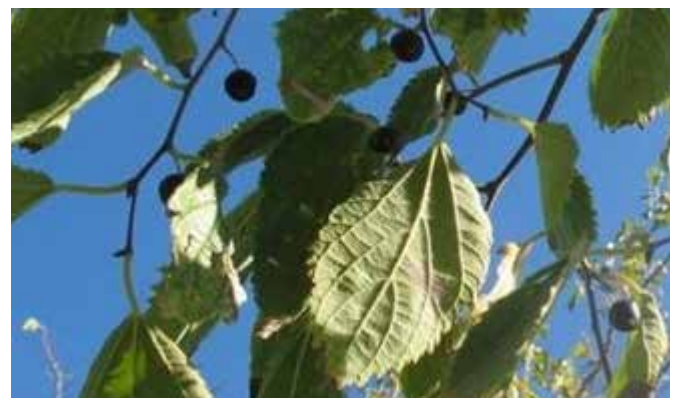
I Bagolari o Spaccasassi di via Campo Marzio