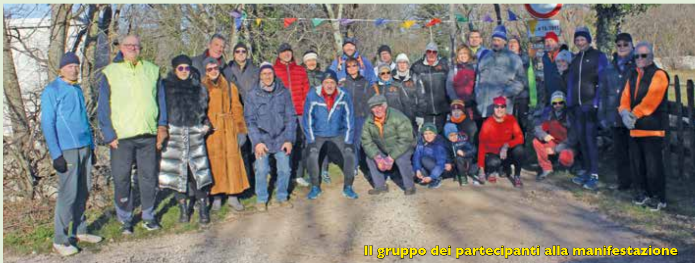
Il gruppo dei partecipanti alla manifestazione