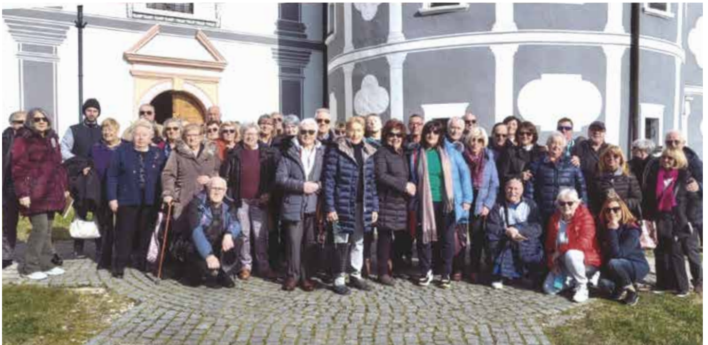
Nella foto i soci felici sorridenti partecipanti alla gita di Rogaska all'esterno del monastero di Olimje