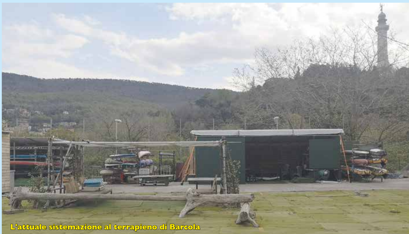
L'attuale sistemazione al terrapieno di Barcola