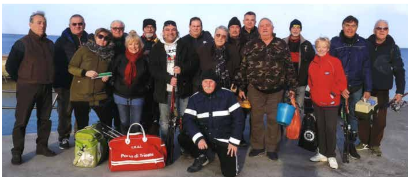
I protagonisti “da barca” sul molo di Zelena in attesa dell'imbarco